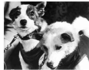
"BELKA" Y "STRELKA"

QUÉ COSAS NO HAS ENTENDIDO: PALABRAS SUELTAS... ANÓTALAS... CON ESAS PALABRAS, ¿PUEDES IMAGINAR QUÉ HA DICHO LA LOCUTORA?