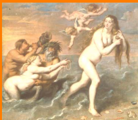
Venus saliendo del mar de Cornelio de Vos