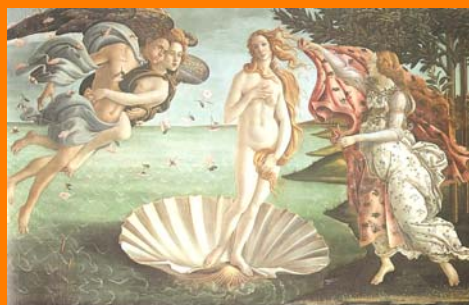
El nacimiento de Venus de Sandro Botticelli (1445-1510)

Sabor de amor, Todo me sabe a ti, Comerte sería un placer, Porque nada me gusta más que tú, Boca de piñón, Bésame con fresasí, Besarte es como comer palomitas de maíz, Corazón de melón, Venus salida del mar, Del negro de un mejillón, Son tus ojos en su punto de sal, Sabor de amor, Tu olor me da hambre, Si no estás mi amor, Muero de sed, Labios de fresa sabor de amor, Pulpa de la fruta de la pasión, Labios de fresa sabor de amor, Pulpa de la fruta de la pasión, Labios de fresa sabor de amor, Pulpa de la fruta de la pasión, Es el sabor de tu amor, Todo me sabe a ti, Comerte sería un placer, Porque nada me gusta más que tú, Boca de piñón, Bésame con fresasí, Besarte es como comer naranjas en agosto y uvas en abril, Sabor de amor, Espuma de mar, Piel de melocotón, orgía del paladar, sabor de amor, Labios de fresa sabor de amor, Pulpa de la fruta de la pasión, Labios de fresa sabor de amor, Pulpa de la fruta de la pasión, Labios de fresa sabor de amor, Pulpa de la fruta de la pasión, Labios de fresa sabor de amor, Pulpa de la fruta de la pasión, Labios de fresa sabor de amor, Pulpa de la fruta de la pasión, Labios de fresa sabor de amor, Pulpa de la fruta de la pasión, Labios de fresa sabor de amor, Pulpa de la fruta de la pasión, Es el sabor de tu amor