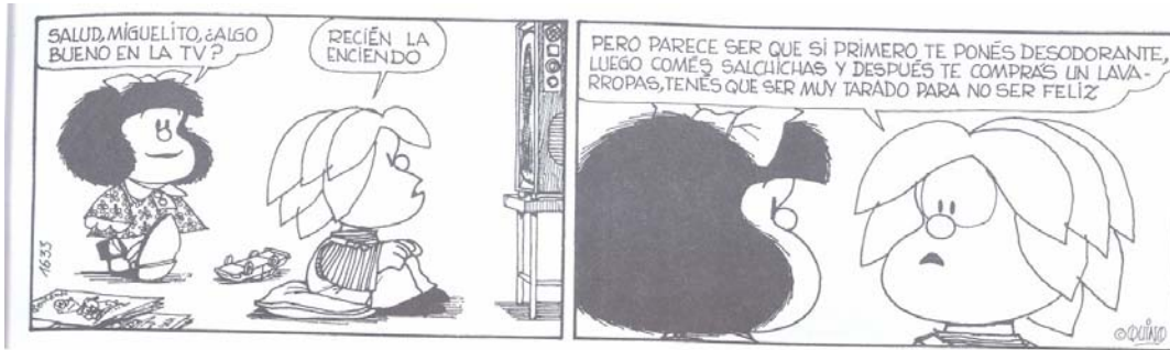
Quino (1993), Toda Mafalda . Buenos Aires, Ediciones la Flor.

¿Qué expresión utiliza Mafalda para saludar a Miguelito?